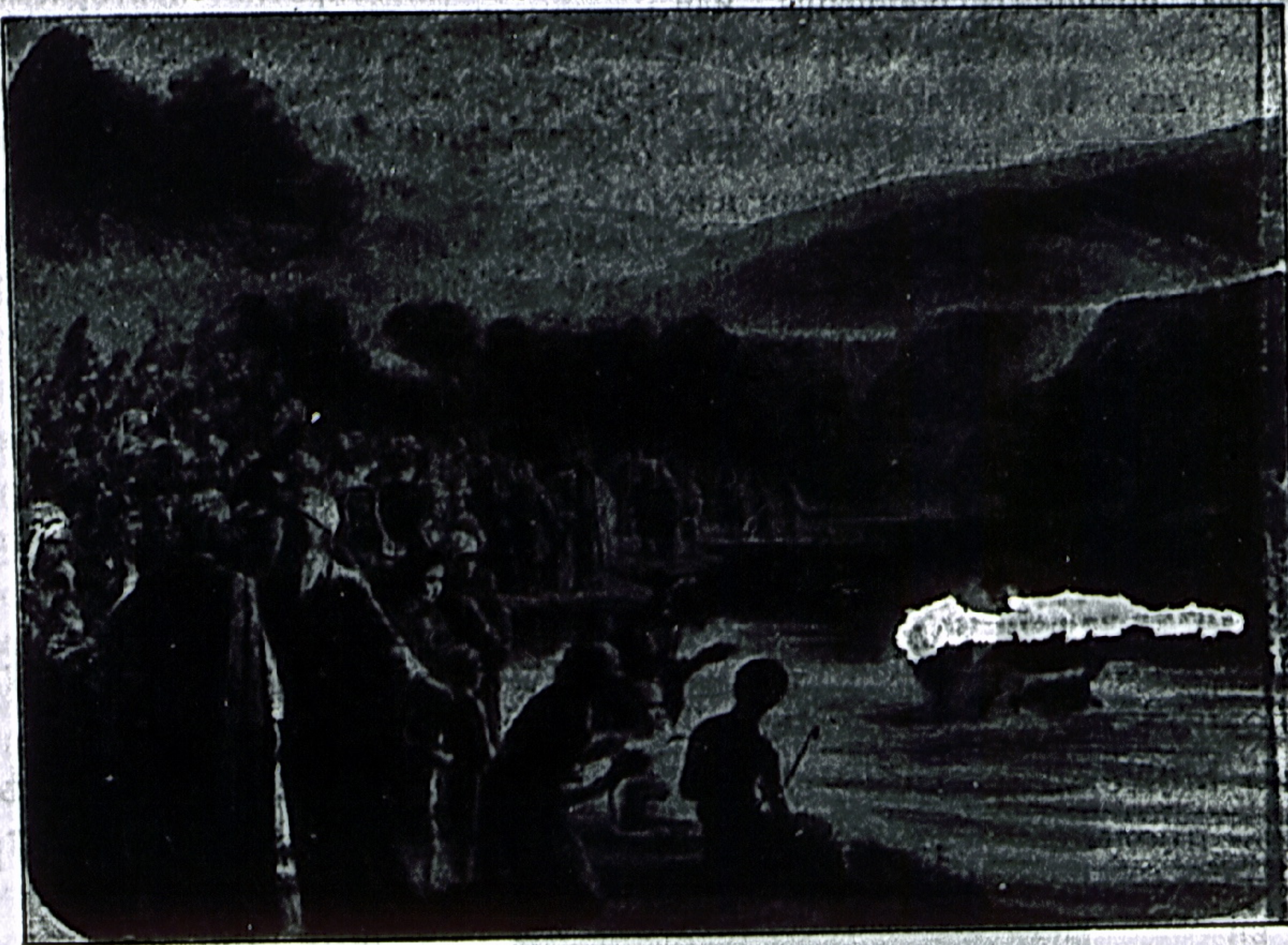
Крещеніе Іисуса Христа отъ Іоанна въ рѣкѣ Іорданѣ.